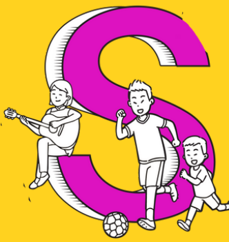
SIHAT DAN SELAMAT